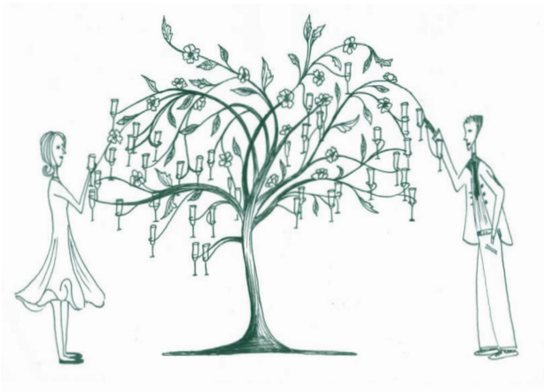
The Enchanting Tree, Tord Boontje, 2013